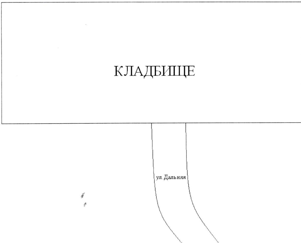
Схема зоны безопасности в радиусе 50 метров от кладбища в п.Каменноостском ул.Дальняя в День поминовения усопших-Радоница